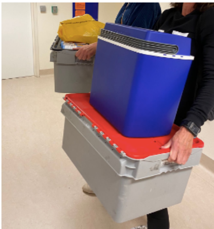
Afbeelding 2: De benodigheden voor een huisbezoek.

Sinds de start van het onderzoek vonden per deelnemer tien bezoeken plaats waarbij bloed werd afgenomen, video's werden gemaakt en er werden vragen aan de deelnemers en hun familieleden gesteld. Voor deze bezoeken werd het vaste onderzoeksteam van het UMCG ondersteund door negen